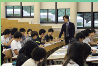
過去のスキルアップセミナー